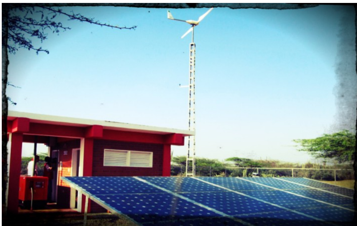
Sistema Híbrido Aislado de Jacuque (Paraguaná, Edo. Falcón-Venezuela). Estos sistemas instalados entre 2008 y 2013 en Venezuela por Fundelec representan el antecedente principal a la propuesta de Territorios Energéticamente Sustentables

Los sistemas aislados suelen ser de baja potencia, mientras que las Microrredes Eléctricas pueden constituirse en proveedoras energéticas tanto en pequeños caseríos como en regiones o estados completos. Cabe destacar que, actualmente, más de 620 millones de personas (dos tercios de la población) en el África subsahariana no tienen acceso a la electricidad. Los que tienen acceso a la electricidad a menudo se enfrentan a precios muy altos para un servicio que es insuficiente y poco fiable. Casi 730 millones de personas utilizan biomasa sólida para cocinar, con las asociadas consecuencias negativas en su salud y el medio-ambiente. Para esta inmensa cantidad de personas, la IEA estima que la electrificación ha de basarse tanto en Microrredes como en Sistemas Aislados (híbridos o no) que proporcionarán electricidad al 70% de la población del África subsahariana, que requiere de electrificación y que se encuentra en las zonas rurales, muy dispersos y apartados de los centros urbanos.