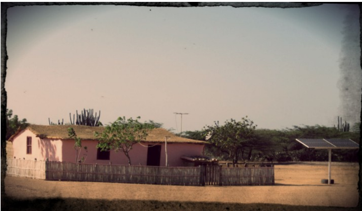
Sistema Aislado basado en Energía Solar Fotovoltaica en vivienda rural de la comunidad de Jacuque (Paraguana, Edo.Falcón-Venezuela). Entre 2005 y 2013 se instalaron 3500 sistemas de este tipo o similares por Fundelec (ente adscrito al Ministerio de Energía Eléctrica de Venezuela) en comunidades rurales, indígenas y fronterizas

Los Sistemas Híbridos Aislados se diferencian de las Microrredes Eléctricas en que éstas últimas se pueden encontrar interconectadas a otras Microrredes Eléctricas, al sistema interconectado nacional y tienen capacidad tanto de aportar energía como de recibirla en momentos en que sus propios sistemas de generación sean insuficientes. Por su parte, los sistemas aislados están encerrados en una comunidad apartada y en ese sentido han servido eficazmente, en Venezuela, para proveer de servicio eléctrico a comunidades indígenas y fronterizas, aisladas de urbanismos y de la red de distribución.